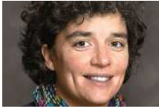
Clémentine Gallet consacre 15% de son chiffre d'affaires à l'innovation.

Elle adapte donc ses solutions à l'automobile où les matériaux composites ont manifestement un réel avenir compte-tenu notamment de leur coût et de leur légèreté. L'entreprise vient d'ailleurs de rejoindre un consortium emmené par Cooper Standard dans le cadre d'un projet labellisé par le pôle de compétitivité ID4Car. Nommé Dynafib, il prévoit le développement de technologies composites thermoplastiques en grandes séries.